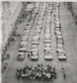
... de Carro